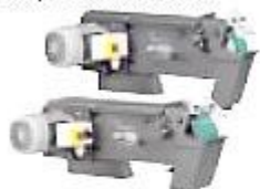
Базисный ленточно-шлифовальный станок