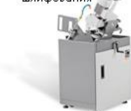
модуль для круглого шлифования